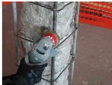
2) Preparazione dei ferri