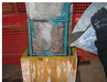
5) Colatura della malta nel cassero