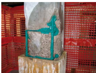
4) Posizionamento casseri e bagnatura supporto