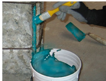
3) Applicazione di ADEFER