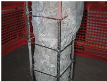
1) Eliminazione delle parti ammalorate